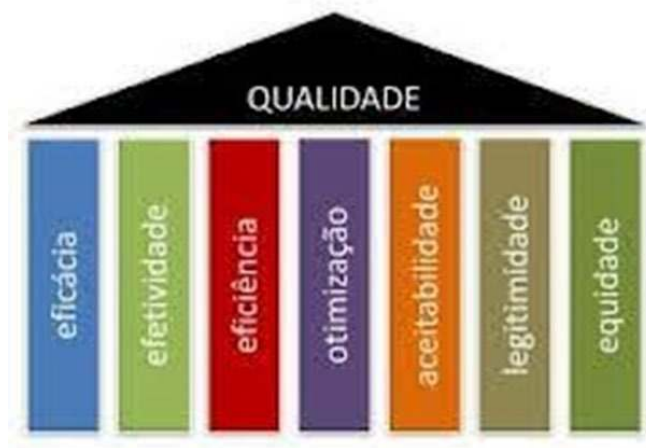
Figura 1: Sete pilares da qualidade em sistema de serviços de saúde.