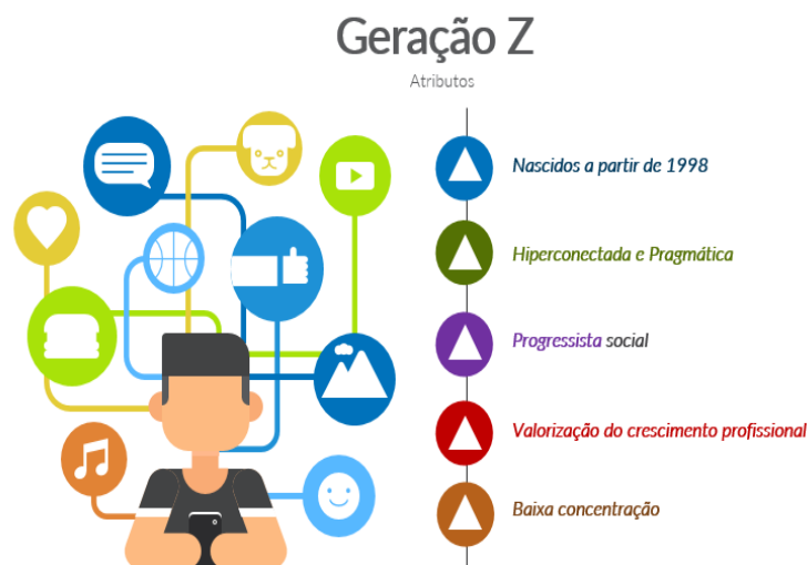
Figura 2 – Principais características da Geração Z