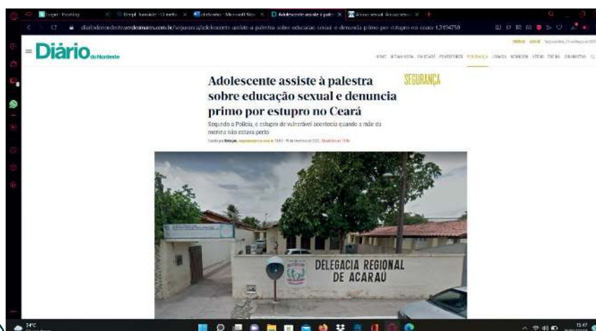
Figura 2: Adolescente que assistiu à palestra sobre educação sexual, com isso obteve informações sobre abuso e denunciou seu primo por estupro no Ceará

Quanto a análise das publicações no Youtube foi observada que as informações divulgadas sobre educação sexual de crianças e adolescentes eram sempre muito relevantes e positivas. Algumas de debates com famosos em ambientes de reportagens, e outras sendo abordadas por profissionais da área da psicologia. Foi observado que a taxa de visualização dos profissionais de psicologia, que teriam mais discernimento sobre o assunto foi menor comparado a quando abordado por famosos, vendo que o fator de influência e visibilidade das pessoas interfere muito na visualização e alcance do tema. Infere-se, portanto, que a necessidade da abordagem do tema busca trazer o conhecimento para as crianças e adolescentes a saberem o limite dos possíveis atos de violação sobre seu corpo. Citado logo abaixo na, figura 2, figura 3.