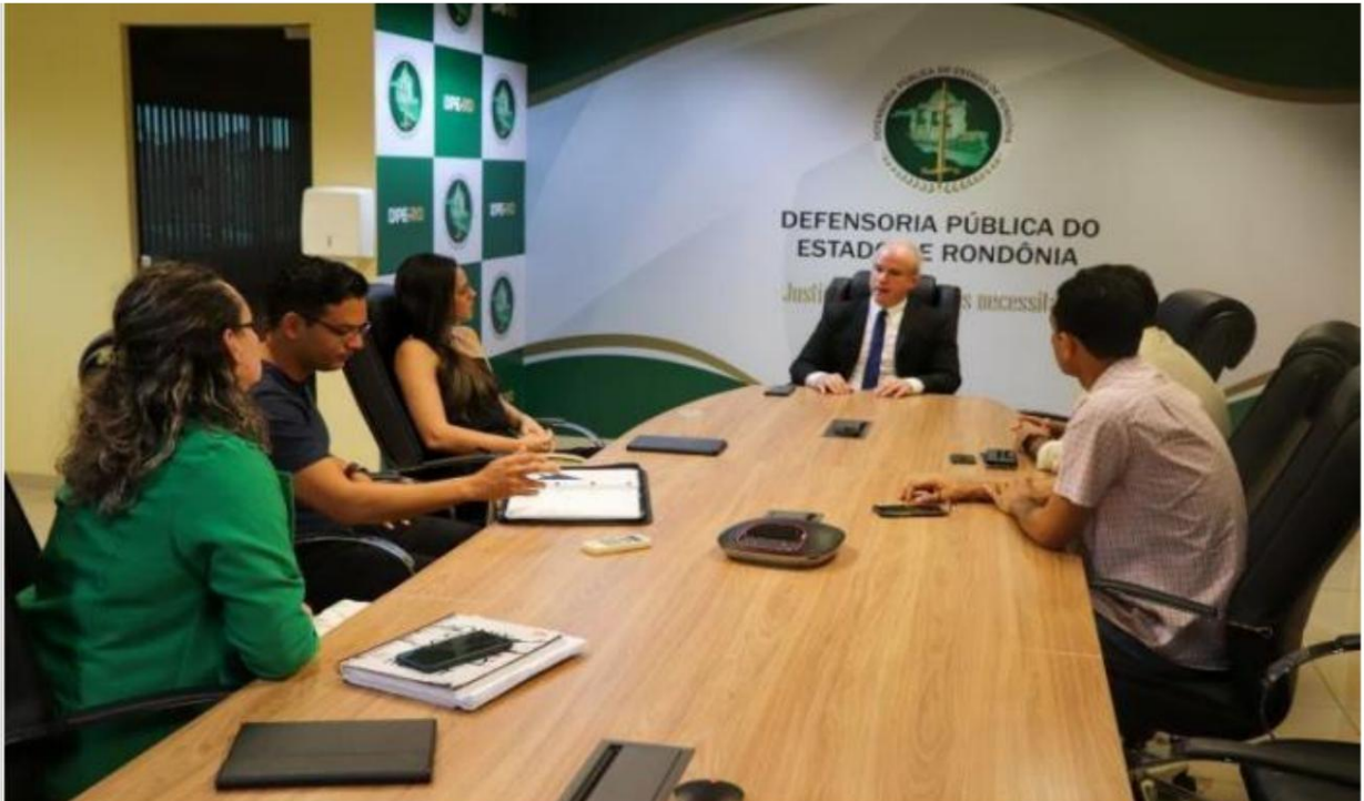
Figura 1 - Reunión institucional en el ámbito de la Defensoría Pública del Estado de Rondônia para articulación del proyecto de extensión