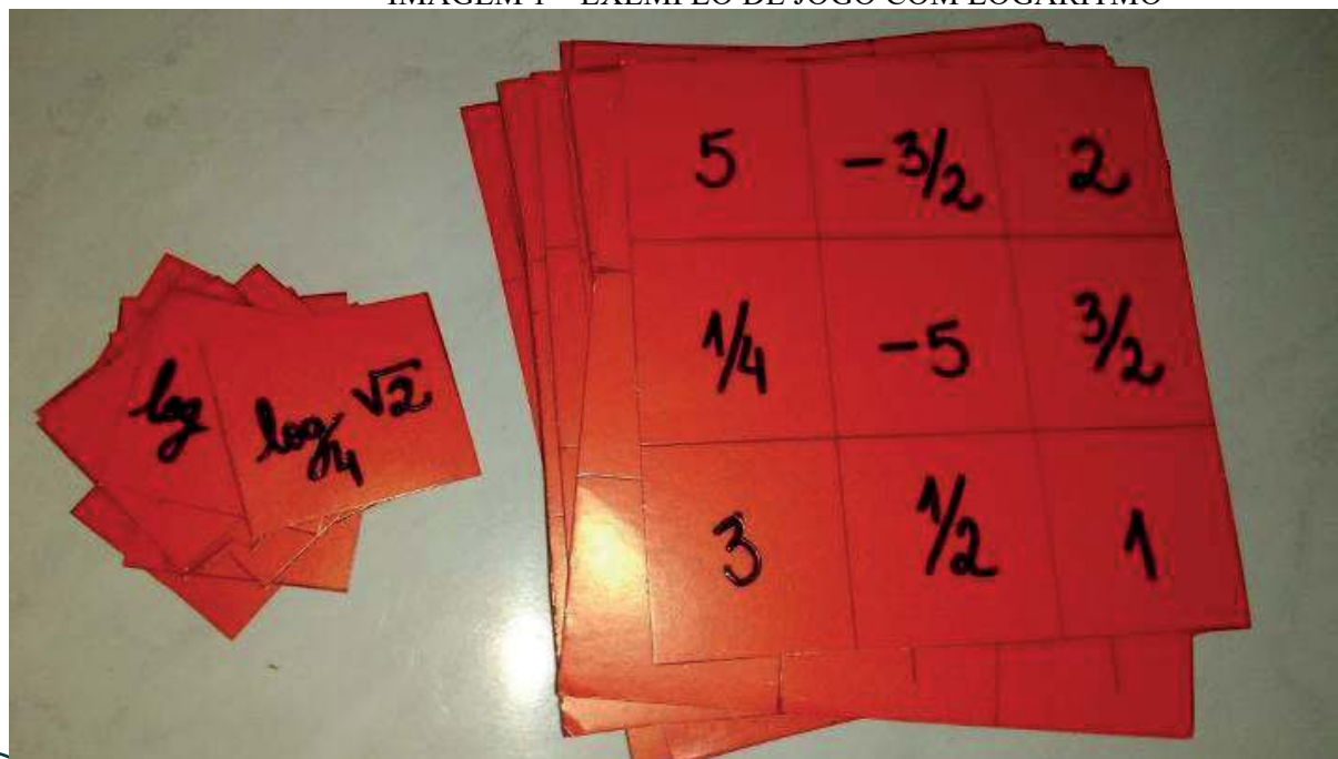
IMAGEM 1 – EXEMPLO DE JOGO COM LOGARITMO

Na atualidade, o ensino dos logaritmos tem sido mais dinâmico e apropriado para o meio no qual são utilizados, como se pode ver no exemplo abaixo: