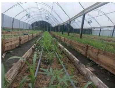
Plântulas de 730 dias com cultivo em Guaratuba