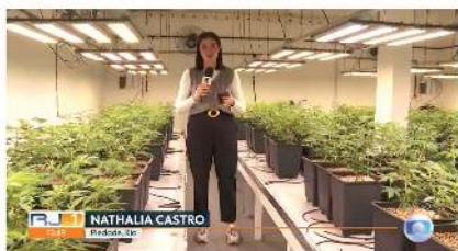
Polícia encontra plantação de skank dentro de uma casa em Pradópolis.

A Polícia Civil do RJ encontrou na manhã desta quarta-feira (24) uma plantação de skank dentro de uma casa em Pradópolis, na Zona Norte do Rio.