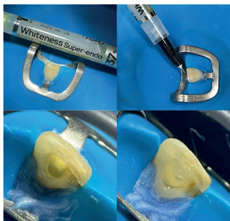
Figura 4. Processo de aplicação do gel clareador Whiteness Super-endo 37% (FGM)

- Explicação: foi realizado o preparo de 3mm da guta percha abaixo do nível cervical, após a remoção da guta percha o dente foi selado com preparado e selado com resina flow Bulk Fill SDR Plus Refil Universal (Dentsply).