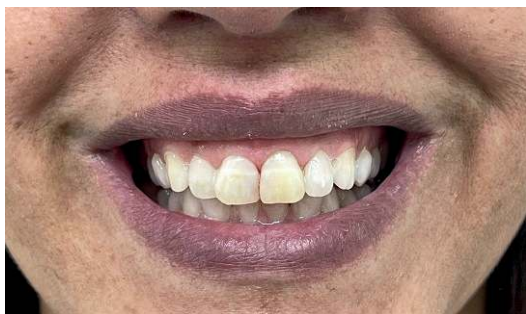
Figura 5. Aspecto final da coloração do dente 21 após clareamento endógeno e exógeno