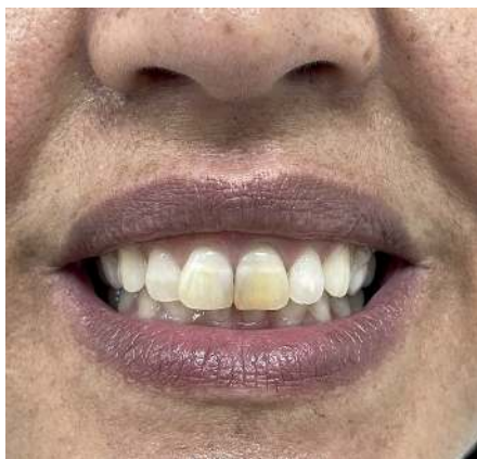
Figura 1. Aspecto inicial da coloração do dente 21