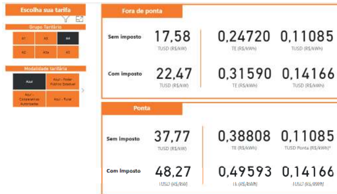
Figura 3 - Tarifas aplicadas ao contrato A4 Azul

No presente momento a empresa farmacêutica, objeto deste estudo, possui um contrato de energia junto ao mercado livre. Desta forma, ela faz parte de um grupo de empresas privadas sem vínculo com as concessionárias de energia do estado, o que garante a ela um preço de energia menor que o praticado atualmente pela empresa concessionária local. Logo as tarifas apresentadas na Fig. 3 não correspondem com a situação atual da empresa. Portanto, para a simulação A4 azul do mercado livre foram utilizados os preços atuais vigentes no contrato da empresa.