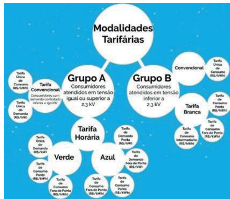
Figura 1 - Modalidades de tarifas

Com base nas definições e caracterizações mencionadas, a Tab. 1 apresenta os parâmetros do contrato do objeto de estudo desta dissertação, referentes ao ano de 2022.