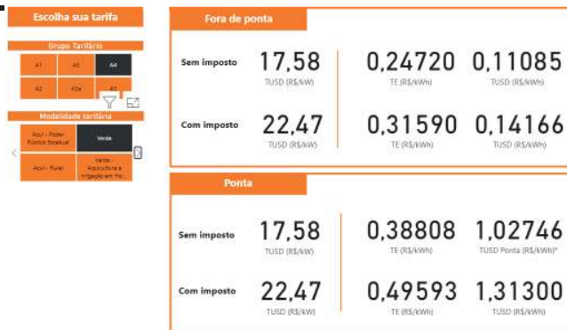
Figura 2 - Tarifas aplicadas ao contrato A4 Verde