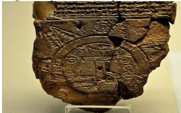
Figura 1: Mapa de Ga-Sur (Mesopotâmia) + 2500 a.C.