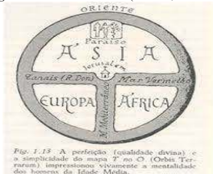
Figura 4: Orbis Terrarum (Isidoro, 570 – 636)

Durante o período da Idade Média (séc. V ao XV) tudo girava em torno da Igreja Católica. Houve, então, um retrocesso não apenas da Cartografia, mas de todas as ciências.