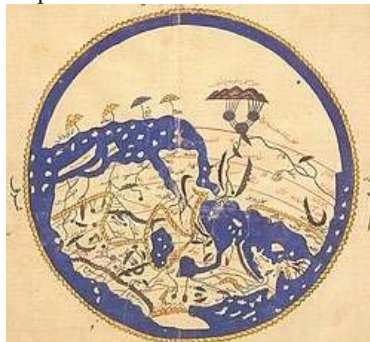
Figura 5: Mapa Árabe do séc. XIII - Alidrisi ( al-Idrisi )

Outra grande contribuição foi a bússola, criada pelos chineses no século II e trazida por eles no séc. XII. Aperfeiçoada pelos portugueses no séc. XVI, orientava a navegação comercial com a sua agulha imantada que é atraída para aproximadamente a direção norte pelo polo norte magnético da terra. A partir daí, tem-se também a rosa dos ventos que acabou por ser incorporada aos mapas. Assim os mapas deixam de ser propriedade, então, exclusivas dos reis e passam a auxiliar os comerciantes e navegadores em busca da colonização de novas terras.