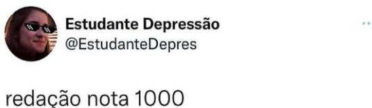
Figura 1 - Redação de estudante do ensino Médio