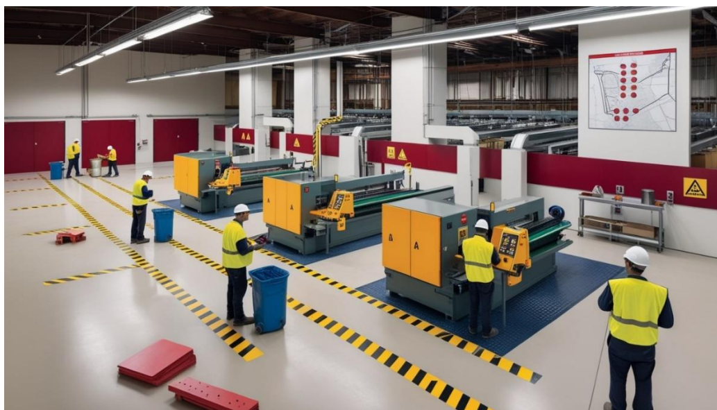
Figura 6. Ambiente de produção

Em ambientes de produção, onde a segurança e a eficiência são cruciais, a cor pode ser utilizada para sinalizar áreas de perigo, identificar equipamentos e orientar os trabalhadores, figura 6 (HASHEMI et al., 2023).