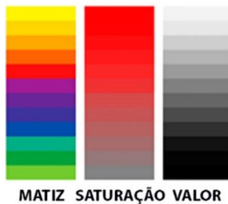
Figura 3 – Características da cor (MCDONALD, 1997).

A cor pode ser verbalmente expressa por três características fundamentais: matiz , saturação e valor . O matiz, ou tonalidade, é o atributo que diferencia uma cor de outra, como vermelho, verde e azul. Saturação se refere ao grau de pureza ou intensidade de uma cor: quanto mais saturada, mais vibrante e nítida é a cor; quanto menos saturada, mais desbotada e próxima ao cinza ela se torna. O valor, ou luminosidade, indica quão clara ou escura é a cor, onde o valor máximo corresponde ao branco e o valor mínimo, ao preto, figura 3 (McDONALDO, 1997).