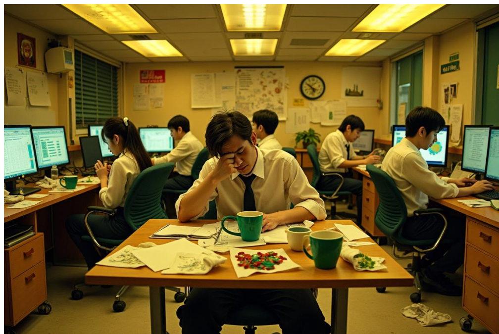
Figura 7. Ambiente administrativo inadequado (autoral)

A saúde ocupacional é um domínio da saúde pública que analisa e atua sobre a prevenção e a ocorrência de doenças e acidentes relacionadas ao trabalho (SCHULTE, CHUN, 2022). A saúde ocupacional designa ações em prol da saúde e do bem-estar dos trabalhadores na forma de ambientes de trabalho seguros e saudáveis. O bem-estar no trabalho é um conceito extenso, que pode englobar um número de componentes da vida do trabalhador, tais como a saúde física e psicológica, a satisfação com o trabalho, o equilíbrio da vida profissional e pessoal e a qualidade das relações interpessoais, figura 7 (WARR, 2007).